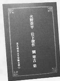
第1号 定価1000円（税込み）

現在書店ではなかなか入手できなくなった北九州ゆかりの文学者の作品を出版し、販売しています。