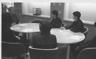
12月19日（ワークステーション） 八幡高校文芸部生徒が館長に取材 7人