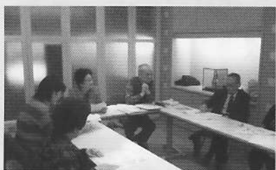
12月17日（ワークステーション） 同人誌「小さい旗」の例会（次号の編集会議など）6人