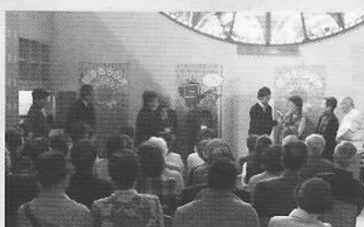
12月22日（交流ステージ） NHK「こんにちは80ちゃん」ラジオ生中継、インタビュー（館長、京町通りの皆さん、清張の会の皆さん）元NHK小倉放送局劇団の皆さんによる「無法松の一生」朗読劇 約50人