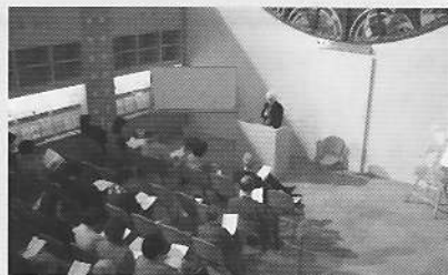
11月23日（交流ステージ） 福岡県詩人会「秋の詩祭 in 北九州 ～扉をおして～」詩の朗読会と長谷部奈美江氏による講演「揺れつづける私と言葉の（現場）」約60人

どちらも貸し出し料は無料です。利用方法や予約など詳しくは文学館事務室（093-571-1505）までお問い合わせ下さい。