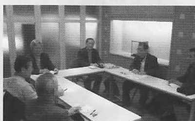
12月16日（ワークステーション） 常盤読書会（月一回） テキストをもとに語り合っている 6人