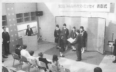
12月3日（交流ステージ） 2006「第5回みんなの作文・エッセイ」表彰式（九州電力株式会社北九州支店主催）入賞者への賞状授与60人